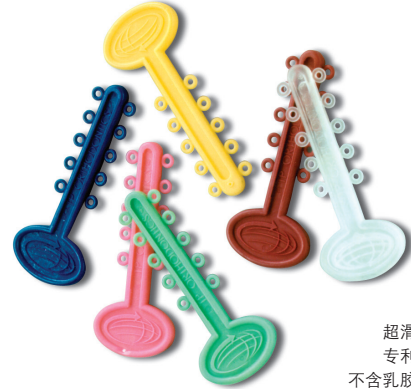
超滑 专利 不含乳胶

迷你结扎圈每条上面有10个结扎圈，其外围直径为3.0mm (.120")。由弹性高、不褪色、不玷污的材料制成。Metafasix 技术使其润湿后表面变得超滑。