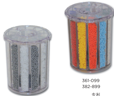
361-098 382-898 不含乳胶